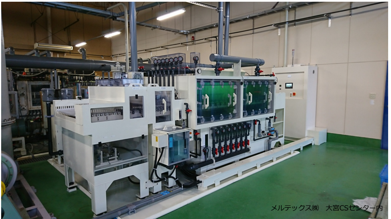
メルテックス(株) 大宮CSセンター内